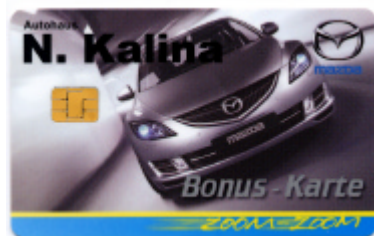
Vorderseite der Karte