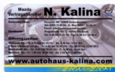
Rückseite der Karte